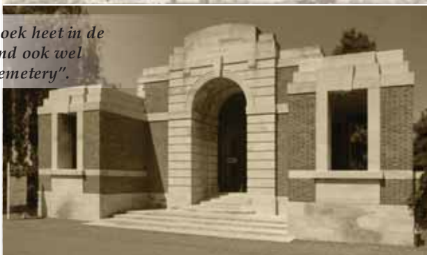
POPERINGHE — Cimetière Remy-(Lyssenthoek) British Cemetery at Remy Siding-(Lyssenthoek)

Lyssenthoek heet in de volksmond ook wel "Remi Cemetery".