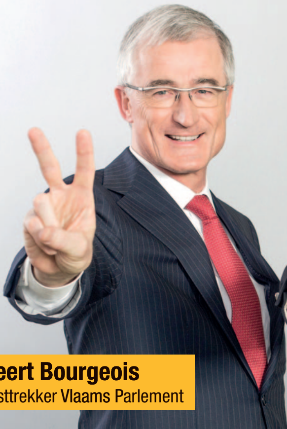
Geert Bourgeois Lijsttrekker Vlaams Parlement